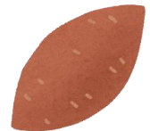
さつまいも sweet potato