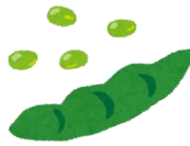
エンドウ豆 green soybeans